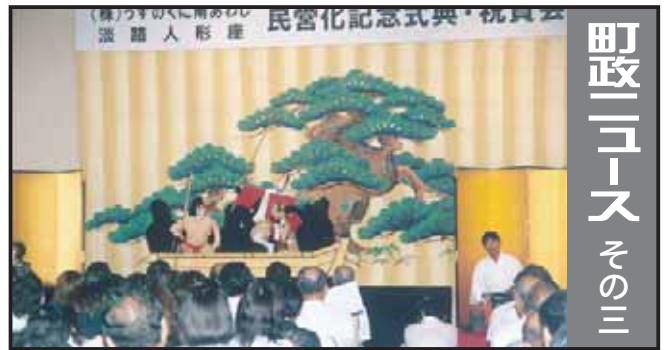
民営化記念式典・祝賀会